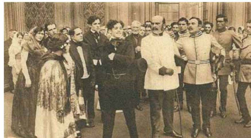
Helena Makowska w filmie „Romanticismo” (1915 r.) Do zaprojektowanego kostiumu aktorka sama dodała elementy polskiego stroju ludowego

Helena Makowska na plakacie do filmu „Kain” z 1918 r. Plakat zaprojektował znany włoski grafik i malarz Marcello Dudovich (1878-1962).