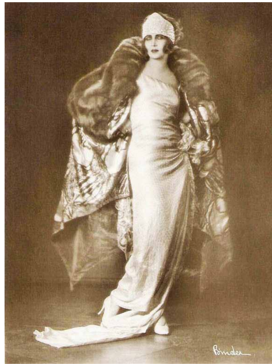
Zdjęcie aktorki po premierze filmu „Rabagas” w 1922 r. w berlińskim atelier