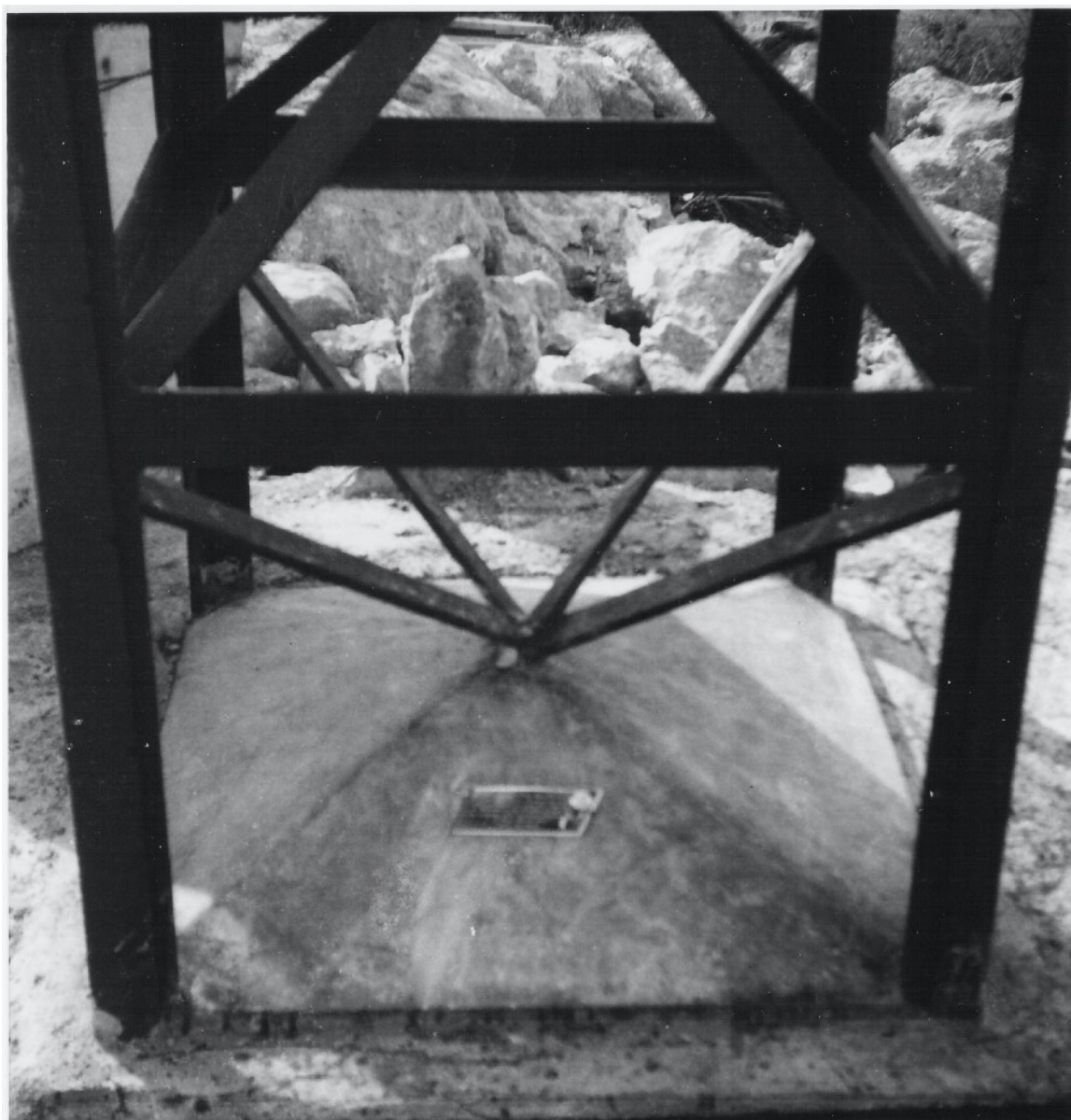
Fot.9. W fundamencie konstrukcji krzyża umieszczona została tabliczka upamiętniająca cel, datę i tych co budowali. Tabliczkę mosiężną (z pocisku) i grawerowanie treści własnoręcznie wykonał i zabetonował plut. Tadeusz Szklarek. W prawym rogu rombu tabliczki wlutowany został guzik metalowy (mały oficerski) z Godłem. Czerwiec 1944 r. (I dekada)