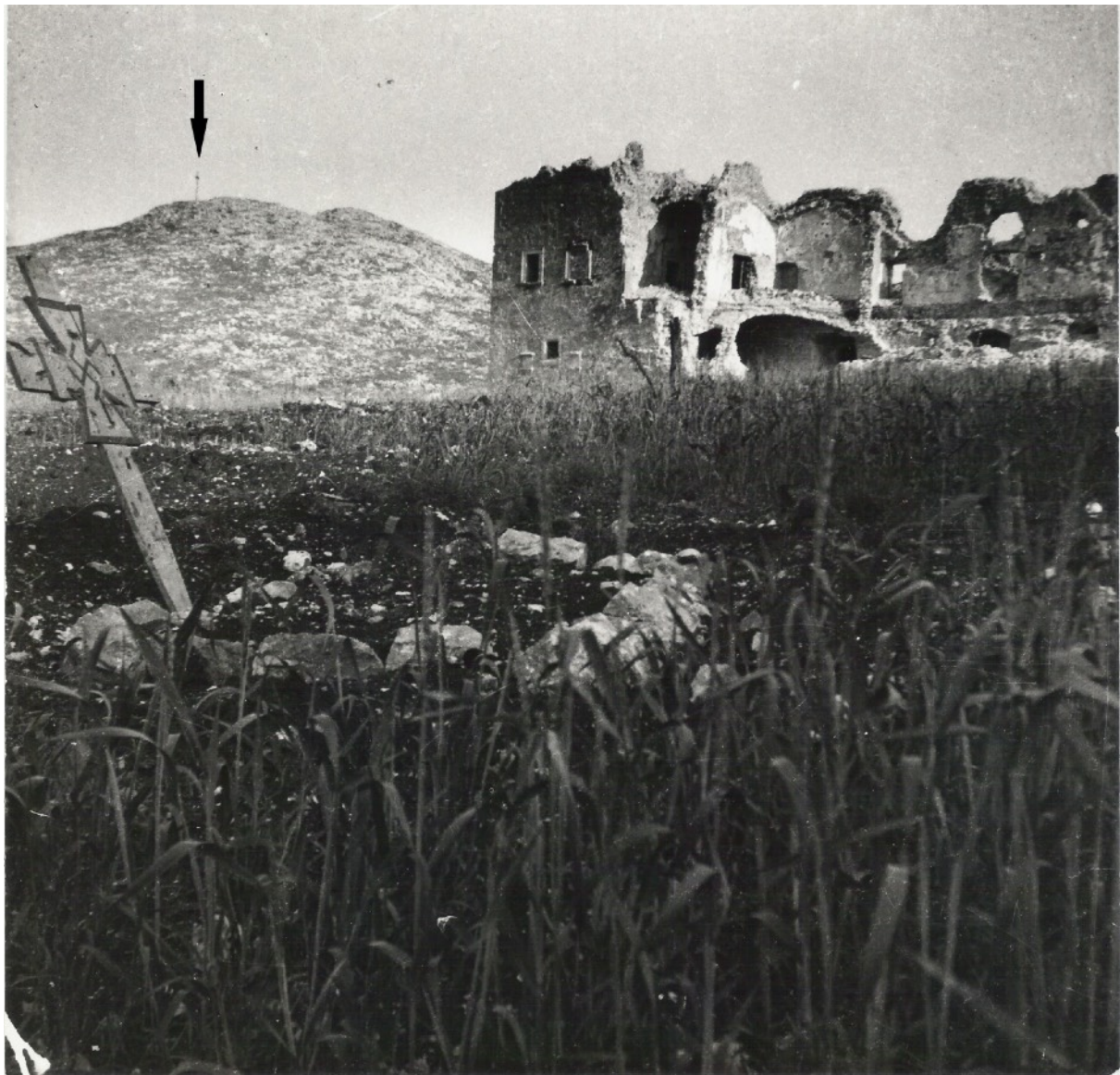
Fot.13. Ostatnie spojrzenie z Mass Albanety na wzgórze „575” z krzyżem – pomnikiem, upamiętniającym pamięć poniesionych ofiar przez 5. Kresową Dywizję Piechoty W.P. w walkach o Monte Cassino w okresie 11 – 18. 05. 1944 r. Czerwiec 1944 r. (I dekada)