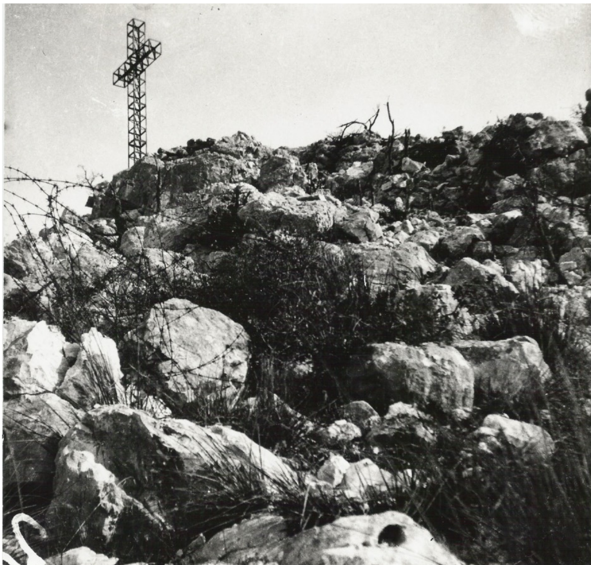
Fot. 8. Zakończenie prac związanych z budową krzyża pomnika 5. KDP na wzgórzu „575” w rejonie Monte Cassino. Zdjęcie od strony płd.-zach. (od strony szosy Rzym – Neapol). Kilka metrów w prawo w szczelinie skalnej, stanowisko poniemieckie na wysokości ok. 3 m. Czerwiec 1944 r. (I dekada).