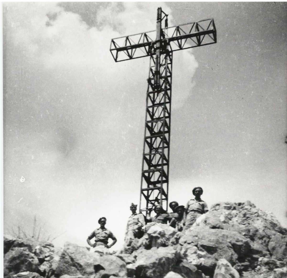
Fot.7. To był chyba najtrudniejszy moment z posadowieniem i montażem ramion krzyża. Po zejściu z konstrukcji-odprężenie nerwowe i wypoczynek. Pozostał tylko jeszcze jeden element „Crib” do nadłożenia konstrukcji krzyża. Maj/Czerwiec 1944 r. (III/I dekada).