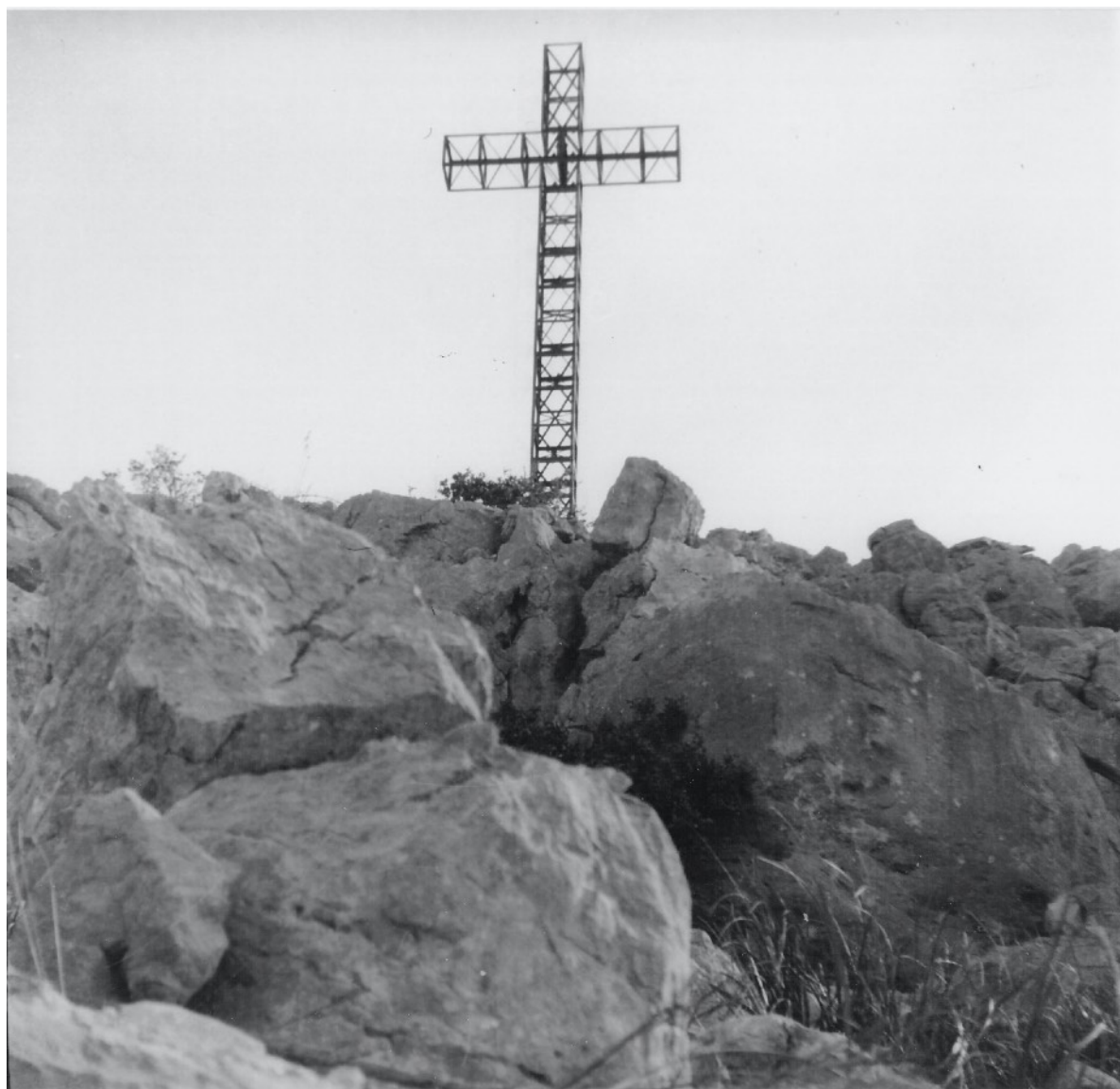
Fot.11. Widok krzyża – pomnika od strony zachodniej. Czerwiec 1944 r. (I dekada).