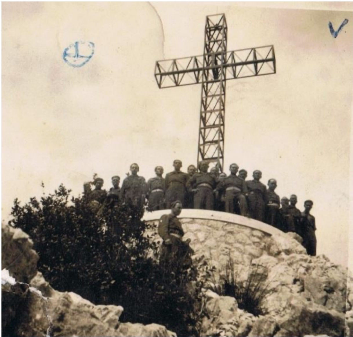
Fot.12. Pamiątkowe zdjęcie po zakończeniu prac nad krzyżem 5. KDP.