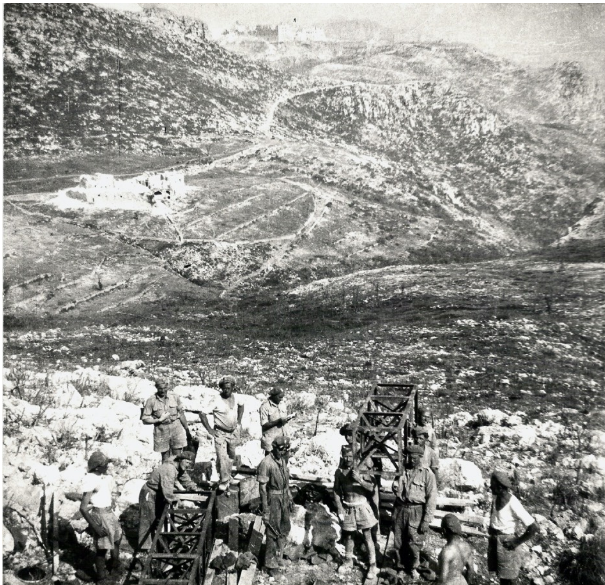
Fot.1. Donoszenie materiałów niezbędnych do budowy Krzyża-Pomnika 5.KDP przez saperów z 4. i 5. kompanii 5. Baonu Saperów (łącznie 16-tu) z rejonu Mass Albaneta na wzgórze „575” – wybrane na budowę pomnika. Na zdjęciu – donoszenie kratownic „Crib” (6-ciu saperów) o wym. 1,85 x 0,6 x 0,6 m – waga ok. 90 kg. Kratownice te stosowano w warunkach polowych do budowy przepustów, podpór mostowych i t.p. Charakterystyczne obiekty na zdjęciu: widoczne przy górnej krawędzi ruiny Klasztoru, w lewym górnym rogu widoczny fragment wzgórza „593”, na którym powstał pomnik 3. Dywizji Strzelców Karpackich (3.DSK), ruiny średniowiecznego folwarku o charakterze obronnym: Masseria Albaneta (poniżej dolnej krawędzi „593”). Maj 1944 r. (III dekada).