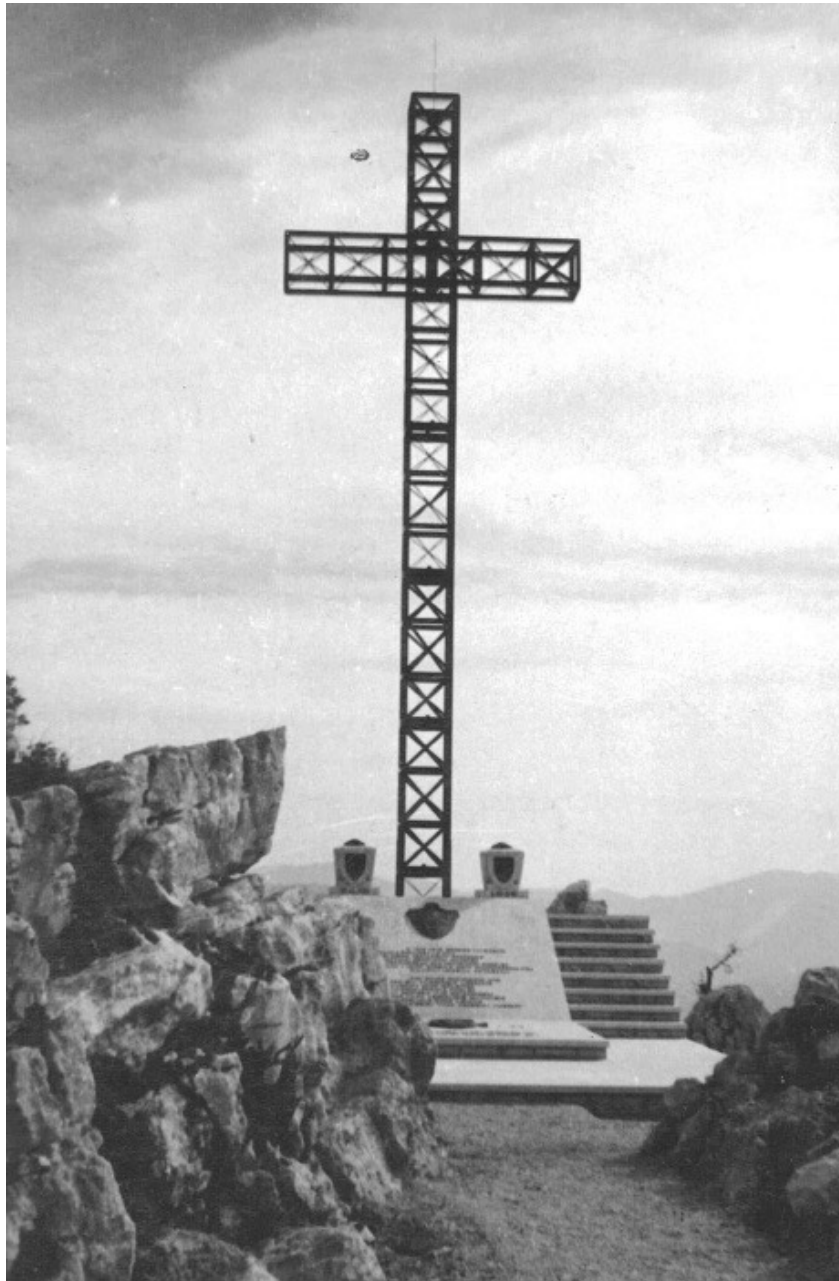
Fot. 14. Pomnik przygotowany do uroczystości. 18.05.1945 r.