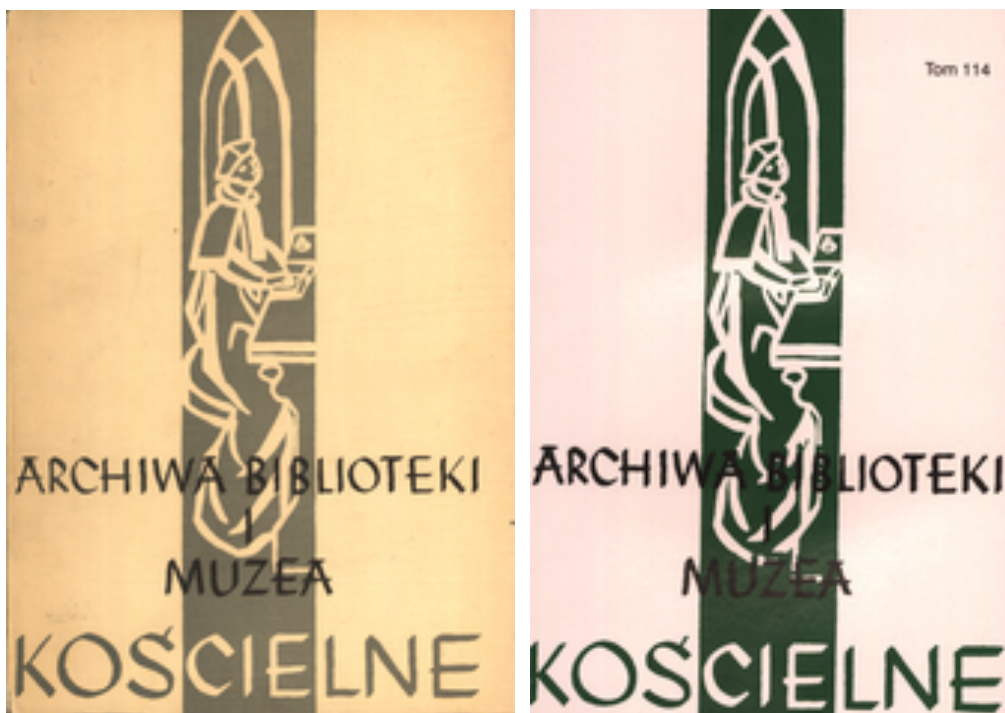
Okładki czasopisma „Archiwa, Biblioteki i Muzea Kościelne” (ABMK) – numeru z 1959 r. oraz 2020 r.

O okolicznościach przyjazdu o. Reczka do Rzymu, podjętych przez niego pracach oraz utworzeniu instytucji działającej dzisiaj pod nazwą Papieskiego Instytutu Studiów Kościelnych (PISK) pisze szerzej o. H. Fokciński SJ w artykułach opublikowanych na łamach wydawanego w Rzymie „Duszpasterza Polskiego Zagranicą” (nr 2/1997) oraz Kroniki Rzymskiej (nr 107/1996).